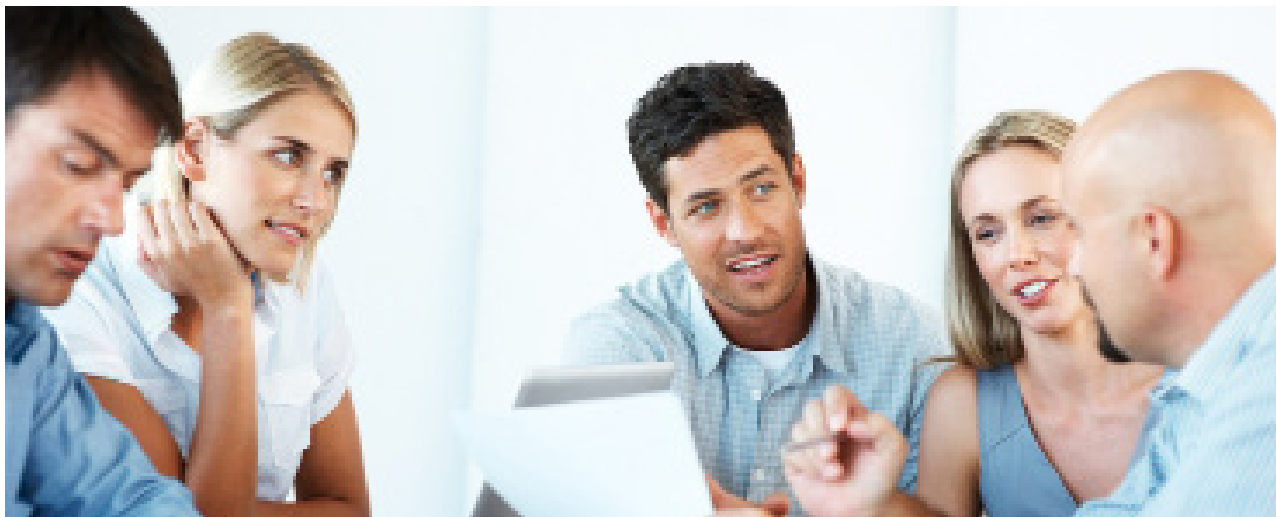
Gabinete de Asesoría Empresarial

Este punto consiste en la identificación de todas las partes interesadas o grupos de interés, que afectan, se ven afectadas o perciben que son afectadas por el desempeño ambiental de la organización. Para ello, se deberán identificar las partes interesadas desde una perspectiva global de la organización y de ciclo de vida de sus productos y servicios. Es por ello, por lo que todos los departamentos son responsables de identificar los grupos de interés del sistema de gestión ambiental.